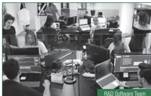
R&D Software Team

Nuestro equipo de profesionales está disponible para escucharte y ayudarte en el Desarrollo de tu proyecto, ofreciendo servicios soluciones completas, integradas, y personalizadas.