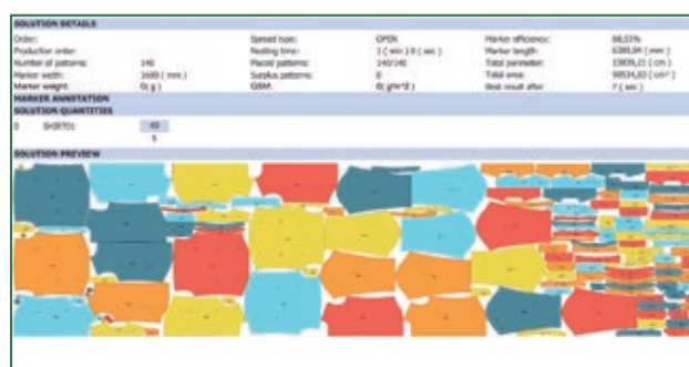
Reporte de la marcada impresa y exportable