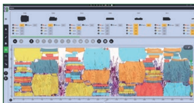
Marcadas tejido a panel