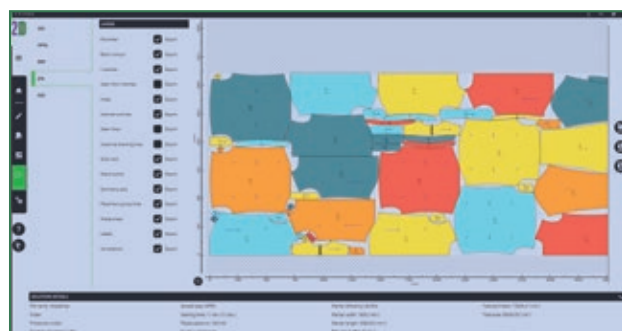
Exportación de las marcadas personalizables a ISO y HPGL