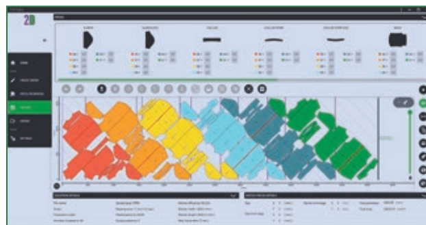
Biblioteca de las marcadas con vista previa