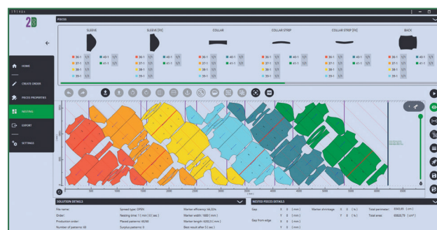
Biblioteca de las marcas con vista previa