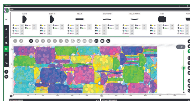
Marcadas tejido a panel