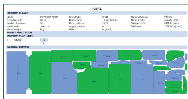
Reporte de la marcada impresa y exportable